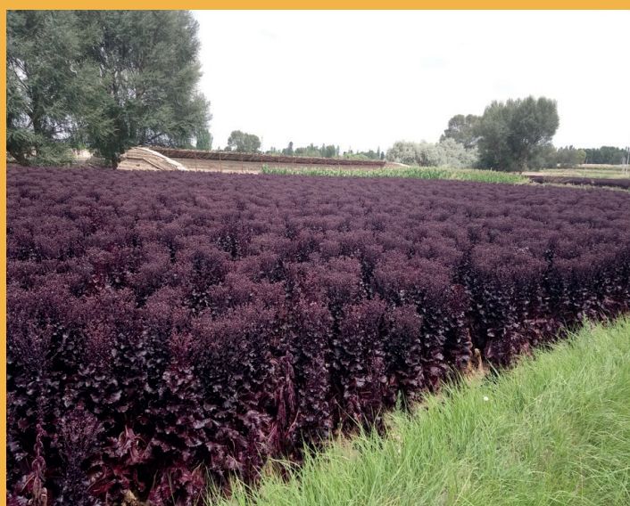
Production de laitue