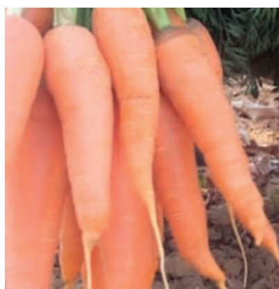
Carotte F1 RIHANNA

F1 RIHANNA, est notre nouvelle variété sur le segment des carottes de contre-saison ! La variété vient compléter notre gamme de carotte à haute performance avec F1 VANESSA pour la saison fraîche et F1 ALICIA, la variété « 4x4 » de la gamme.