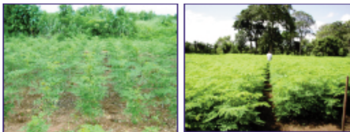
Planche 3 : Culture intensive (plantations jeune et avancée).